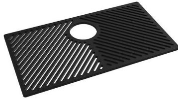
Griglia Black 8100 653