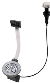
Vidange automatique 8407 100