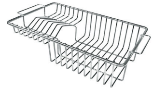
Panier à vaisselle inox 8100 201